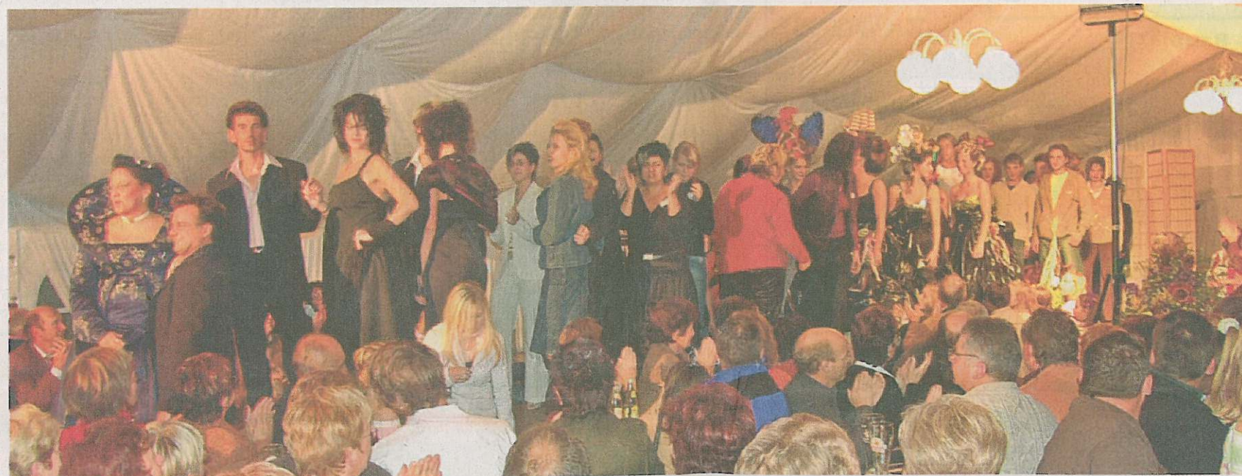
Die Modenschau am Samstag, 15. September um 19 Uhr, verspricht, wie vor zwei Jahren in Untermaxfeld, wieder ein Publikumsmagnet zu werden.