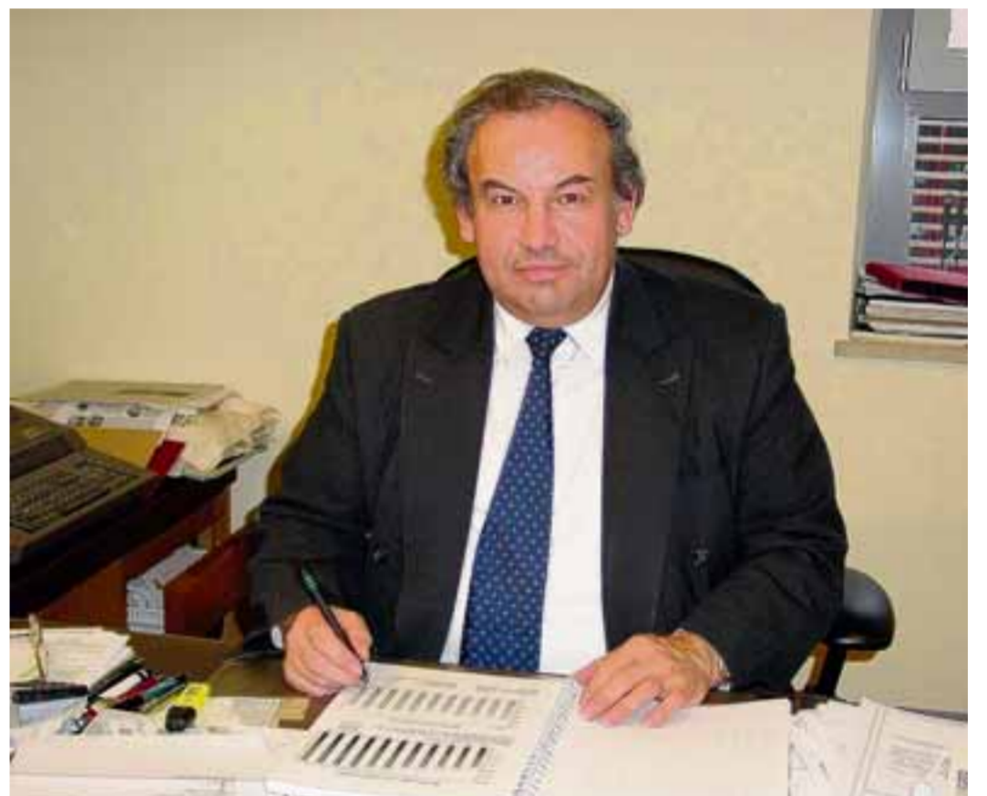
Bürgermeister Karl Seitle zeigt sich zufrieden mit den Ergebnisse des letzten Jahres.