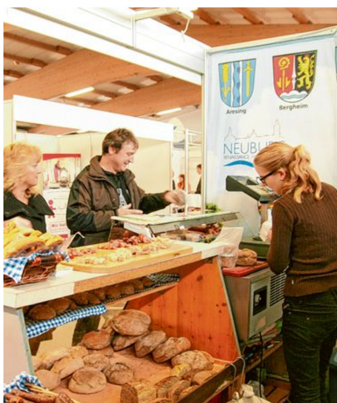
Erstmals bieten die Aussteller ihre Waren und Dienstleistungen zum Verkauf an – da finden die Besucher sicher das eine oder andere Schnäppchen.