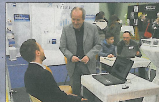
In der Halle gibt es die Möglichkeit, sich bei einem Test am Computer über seine persönlichen Stärken und Schwächen zu informieren. Jeder Teilnehmer erhält Vorschläge für Berufe, die am besten passen.